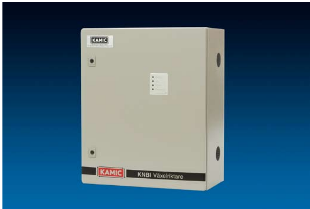
KNBI - reservkraftaggregat för belysning.