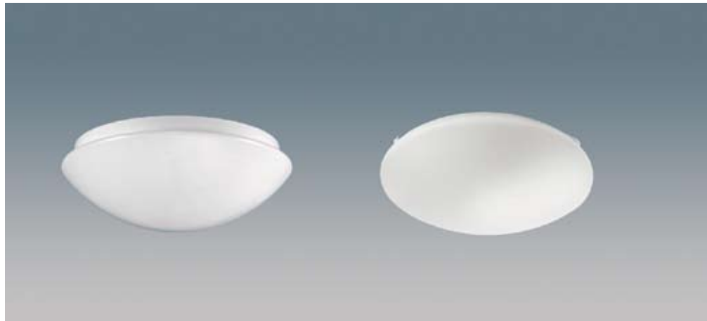
Kupa i PMMA och stomme i plast alt. slagtålig Polycarbonat kupa och stomme i plast.