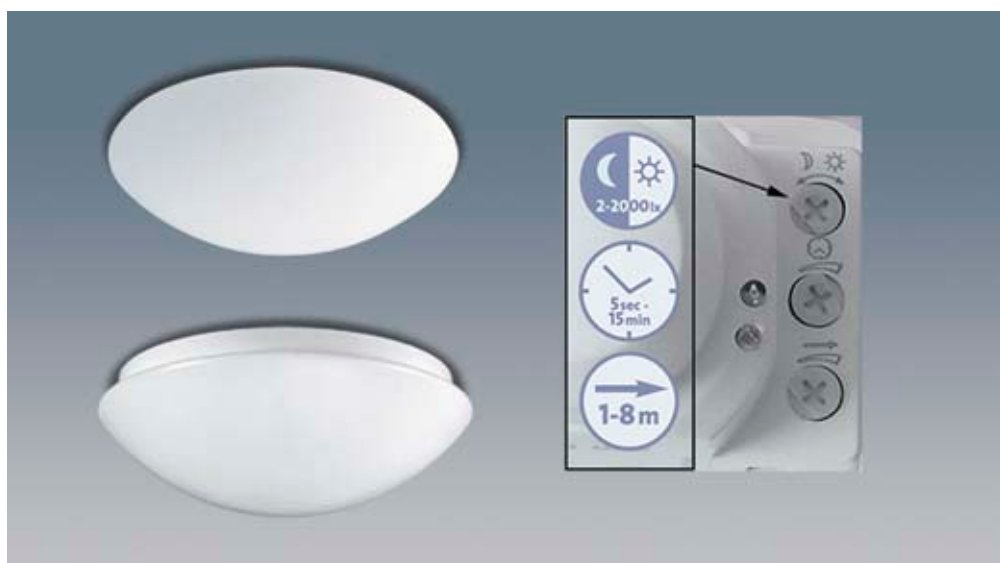
Flat Basic/ Flat Polymero - armaturer lämpade för såväl privata som offentliga miljöer.