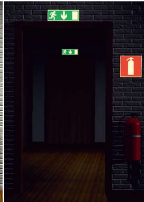
Efterlysande skyltar belysta med lysrörsarmatur samt effekt vid strömbrott.