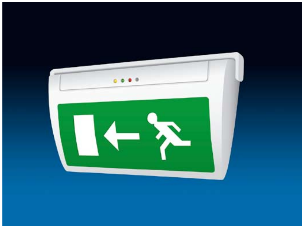
Easy LED, nödbelysningsarmatur med elegant och modern design.

Till produktfamiljen hör även specialversioner som armatur med potentialfri larmutgång samt ljusreglerbar biografmodell.