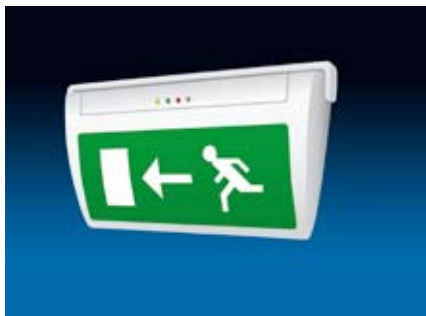
Enkel och snabb att montera