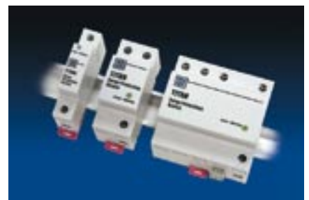
EFI - Överspänningsskydd