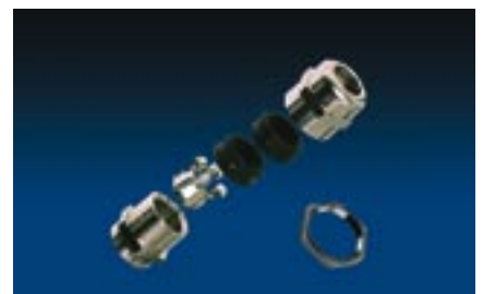
EMC - förskruvning