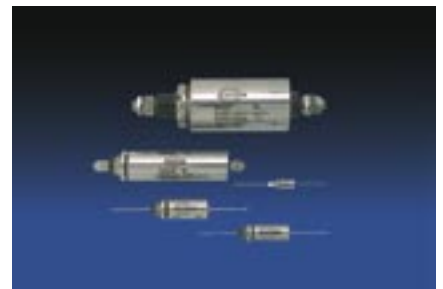
Kondensatorer - filter